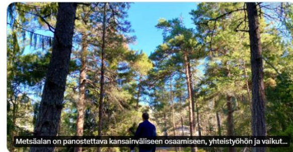
Metsäalan on panostettava kansainväliseen osaamiseen, yhteistyöhön ja vaikut...

Koko metsäalalla tarvitaan toimia EU-tiedon ja kansainvälisen osaamisen vahvistamiseksi, todetaan Tapiion koordinoiman ja @mmsaatio rahoittaman hankkeen johtopäätöksissä. #kansainvälisyys #mmsaatio