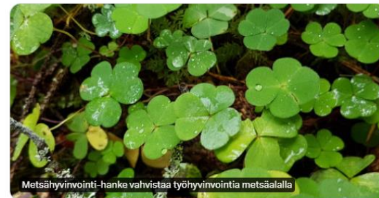
Metsähyvinvointi-hanke vahvistaa työhyvinvointia metsäalalla

#Työhyvinvointi on päivän sana. Metsäalalla on oma verkosto, joka on ottanut asiakseen työhyvinvointi-osaamisen kehittämisen. Katso tästä #Metsähyvinvointi-hankkeen kuuluiset ja tule mukaan. #mmsaatio @Metsähyvinvointi