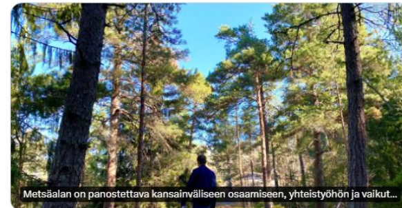
Metsäalan on panostettava kansainväliseen osaamiseen, yhteistyöhön ja vaikut...

Koko metsäalalla tarvitaan toimia EU-tiedon ja kansainvälisen osaamisen vahvistamiseksi, todetaan Tapiion koordinoiman ja @mmsaatio rahoittaman hankkeen johtopäätöksissä. #kansainvälisyys #mmsaatio